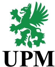
UPM-Kymmene Oyj (Финляндия)